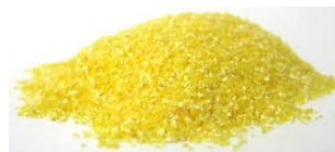
ŠOLSKA TABLICA ALI KORUZNI, PŠENIČNI ZDROB