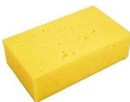
KREDA IN GOBA ZA BRISANJE