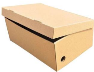
ŠKATLA OD ČEVLJEV